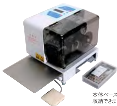
本体ベース部分に活字を収納できます